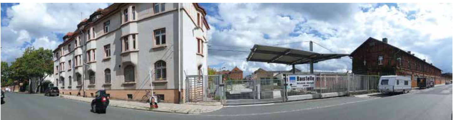
Eine ganze Reihe entlang der Weißenburgstraße unter Denkmalschutz: Angefangen mit dem Offiziersbau 7108, dem einstigen Arbeitsplatz von Claus Schenk Graf von Stauffenberg mit den markanten Erkern links.