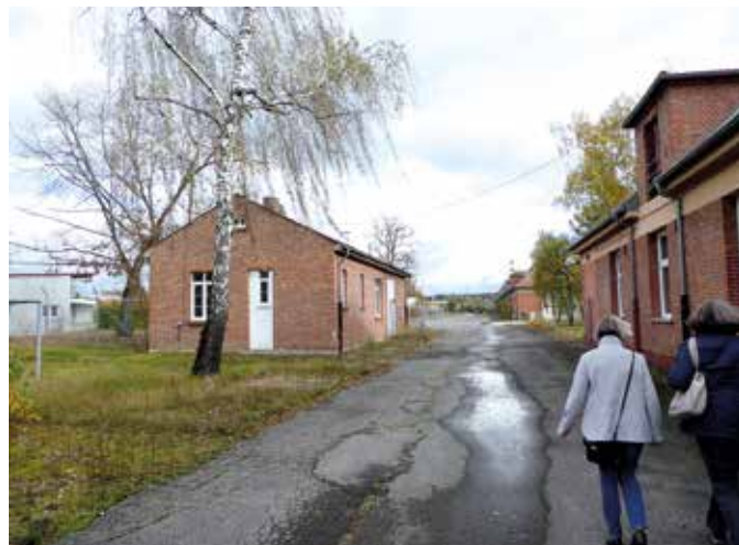
Nachbarn in gutem Zustand: Links Haus 7118, rechts die ehemalige Bank, Haus 7117.

Grundstock für ein Museum, das einen Beitrag zur Erinnerung an die Anfänge der guten (und in diesen Tagen mehr denn je erinnerungswürdigen) deutsch-amerikanischen Beziehungen leisten kann. Auch den zur Munitionsfabrikation eingesetzten Zwangsarbeitern könnte hier zentral gedacht werden. Darüber hinaus würde ein solcher Gedenkort als Mahnmal für die Zeit des Krieges und die Wahrung des Friedens dienen.