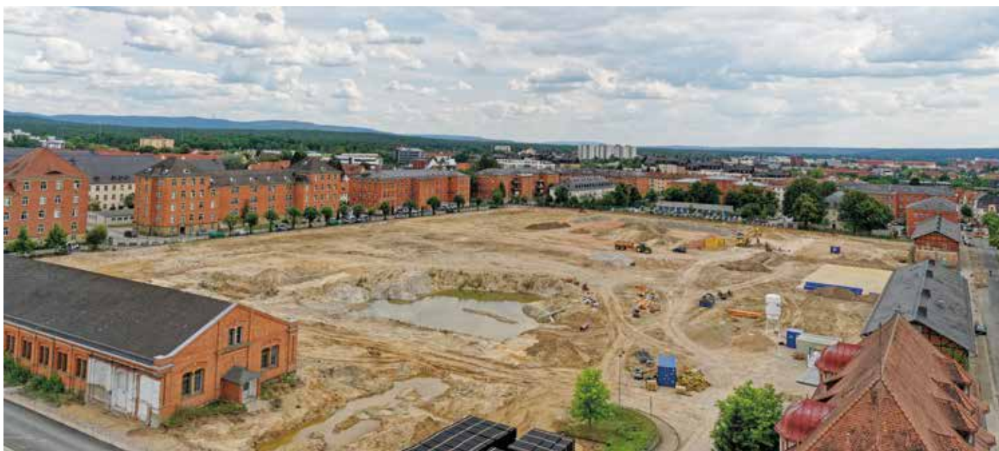
Ein ungewohnt freier Blick über den einstigen Exerzierplatz.