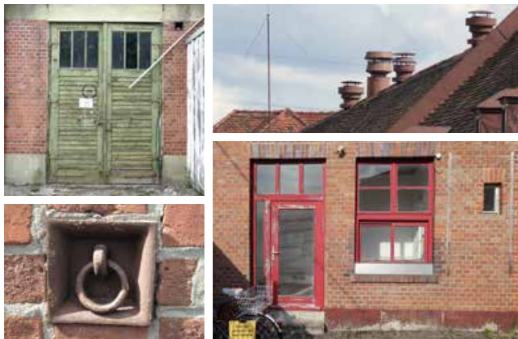
Drohen zu verschwinden: All die reizvollen Details der letzten 90 Jahre Geschichte der Lagarde.