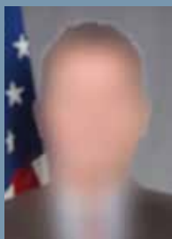
N.N. Botschafter der USA in Deutschland