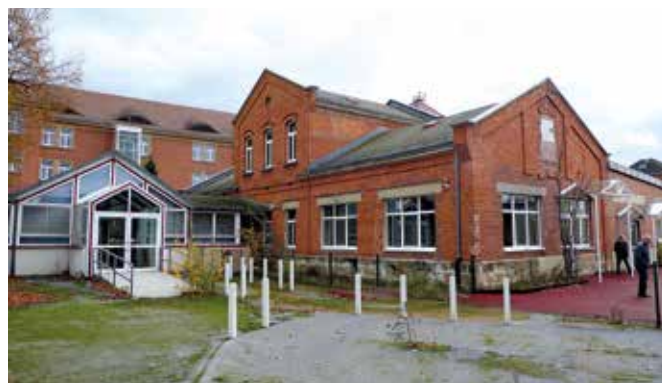
Denkmal mit noch ungewissem Nutzungskonzept: Die ehemalige Büchsenmacherei Haus 7111 – hier noch mit den leider inzwischen verschwundenen Ergänzungen aus seiner amerikanischen Zeit – auch sie Zeugnisse der Geschichte. Übliches Schema: Nicht älter als 75 Jahre, daher erst mal „Rückbau“ der Anbauten, erst dann nachdenken, ob man sie vielleicht hätte brauchen können.

Wir hoffen, dass der durch Corona und den