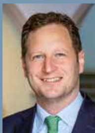
Georg Friedrich Prinz von Preußen