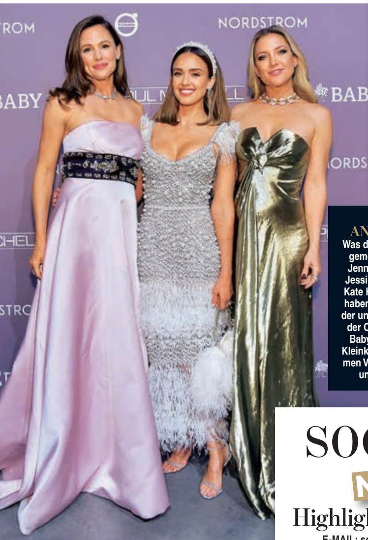
LOS ANGELES Was diese Grazien gemein haben? Jennifer Garner, Jessica Alba und Kate Hudson (v.l.) haben je drei Kinder und sind Gäste der Charity-Gala Baby2Baby, die Kleinkinder aus armen Verhältnissen unterstützt