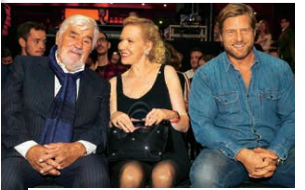
KÖLN Standing Ovation gab's von den NRW Kinoprogramm-Betreibern für Mario Adorf bei der Verleihung des mit 20000 Euro dotierten Herbert-Strate-Preises. Laudatorin Sunnyl Melles schwärmte vom Einfühlungsvermögen Adorfs und seinem Eros. Für Henning Baum (r.) ist er „ein ganz Großer!“