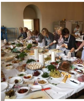
2017: Vorbereiten der Canapees in der Küche der Residenz

Auf der festlich gedeckten Tafel im historischen Ambiente des Kaisersaals der Residenz funkeln Silberleuchter und Silberplatten. Wie schon 1949 wird edler Tee aus Silberkannen ausgeschenkt und die Gäste werden mit erlesenen Canapees, von Damen des Clubs selbst liebevoll zubereitet, bewirtet.