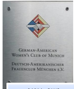
Schild des GAWC am Hotel Hilton Munich Park

Neben unserem sozialen Engagement und der aktiven Unterstützung der deutsch-amerikanischen Freundschaft pflegen wir im GAWC ein vielfältiges Clubleben. Einmal im Monat treffen wir uns zum Mitgliedertreffen, seit vielen Jahren im Hotel Hilton Munich Park.