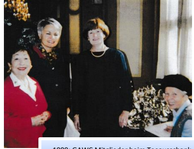
1999: GAWC Mitglieder beim Teeauschank

Der Silbertee ist zu einem begehrten Event geworden, ca. 750 Gäste folgen jedes Jahr gerne der Einladung und fördern mit ihren Spenden die Ziele des Clubs.