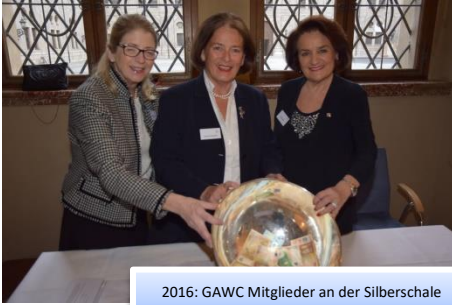
2016: GAWC Mitglieder an der Silberschale