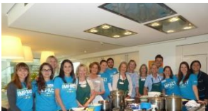
Sommer 2016: Gemeinsam wurden die im Haus lebenden Familien mit einem leckeren Mittagessen verwöhnt