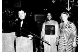
1991: Ministerpräsident Franz-Josef Strauß auf dem Magnolienball

Einmal allerdings gab es eine Ausnahme: 1991 wurde wegen des Golfkrieges der Magnolienball im Fasching abgesagt. Er wurde am 27. Juni 1991 nachgeholt.