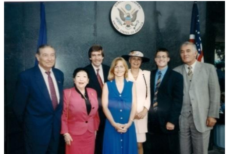
1998: Feier zum 4th of July im amerikanischen Generalkonsulat