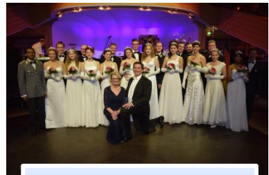
2017: zum ersten Mal Debütanten und Debütantinnen beim Magnolienball