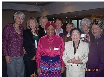
Treffen der Alt-Präsidentinnen 2008