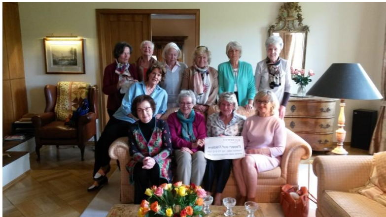
Eine der ältesten Aktivitäten des GAWC (seit 1967): Essen-auf-Rädern-Gruppe