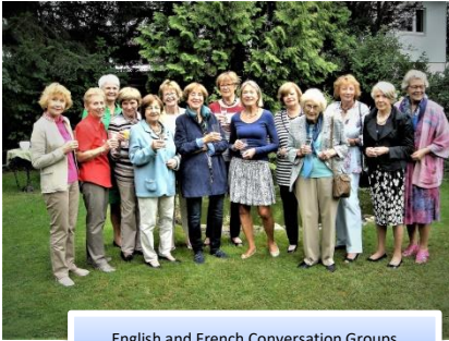
English and French Conversation Groups