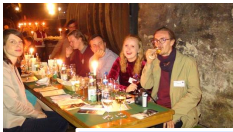
Studenten bei der VDAC Convention 2017

SWM hat ein beliebtes Werbungsmotto: in einer Luftaufnahme von München in der Nacht glänzt unsere Isarstadt mit Lichtern - "München leuchtet". Ich denke an diese Anzeige, wenn ich an meine Zeit in Deutschland denke. Wenn jeder Ort und jede Person, die mich verändert hat, wurde in das Stromnetz eingespeist, dann auf einer Satellitenkarte leuchtet nicht nur München, sondern ganz Deutschland.