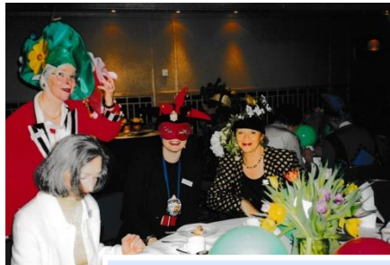
2001: Fasching beim Mitgliedertreffen