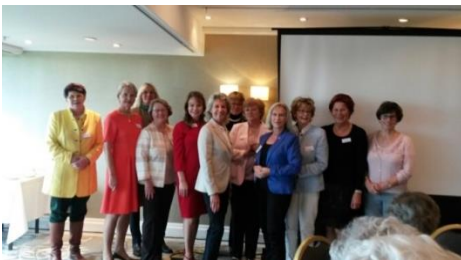
Vorstand beim Mitgliedertreffen September 2017