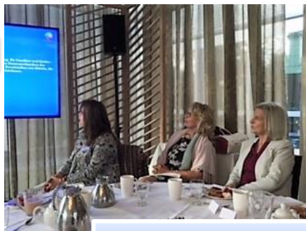
2017: Mitgliedertreffen mit Vortrag

Daneben organisieren die Clubmitglieder privat in kleineren oder größeren Gruppen zahlreiche Aktivitäten. Wer möchte, kann jede Woche an mehreren Veranstaltungen teilnehmen.