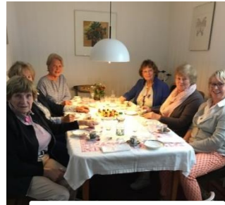
Cooking with Friends