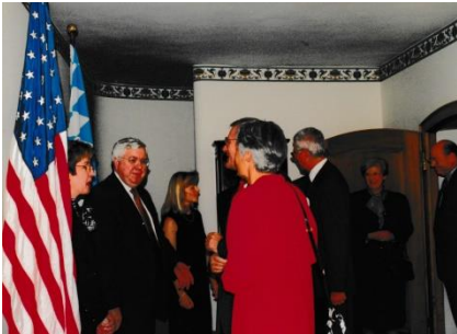
1997: Besuch Botschafter Kornblum beim US-Generalkonsul George Glass