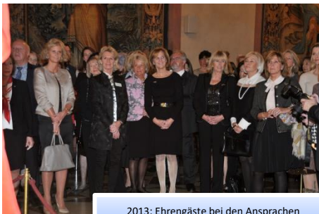
2013: Ehrengäste bei den Ansprachen

Seitdem hat der GAWC jedes Jahr Gäste aus Politik, Wirtschaft und Gesellschaft zum Silbertee geladen, zuerst in die Münchner Schack Galerie, dann in das Antiquarium der Residenz und seit einigen Jahren in den Kaisersaal der Residenz.